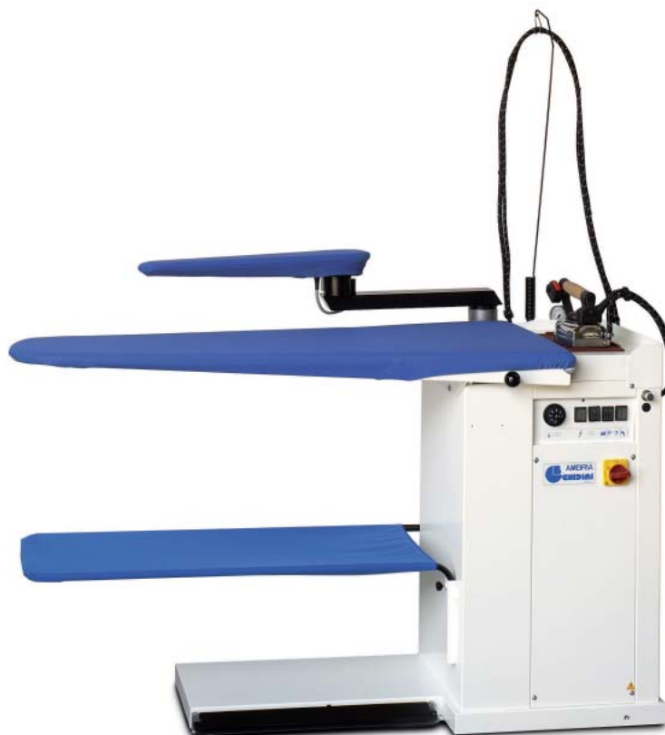
Table universelle aspirante et chauffante, avec chaudière et aspirateur